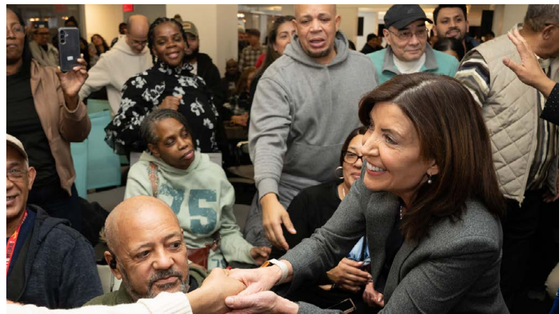
Kathy Hochul gobernadora del Estado de Nueva York saludando a un miembro de UNITE HERE Local 100.