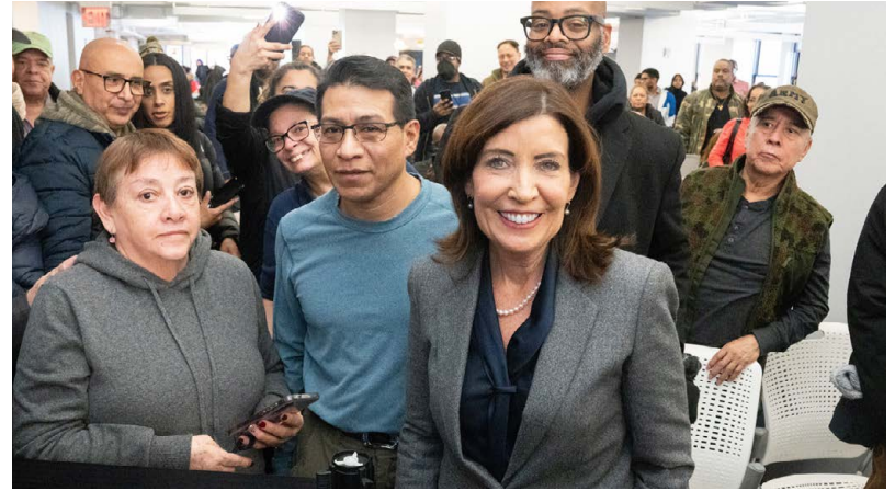
New York Governor Kathy Hochul with Food Service Workers at Paramount.