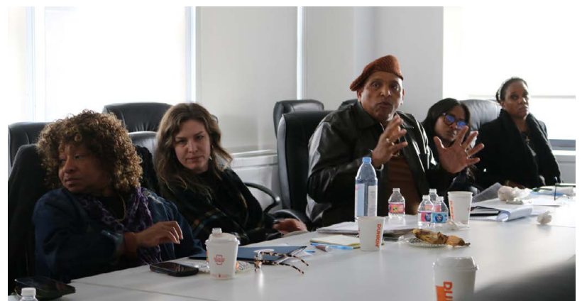
Miembros líderes de UNITE HERE Local 100 en el evento de liderazgo del Mes de la Historia Negra.

El verdadero liderazgo se basa en la confianza y la unidad. Al