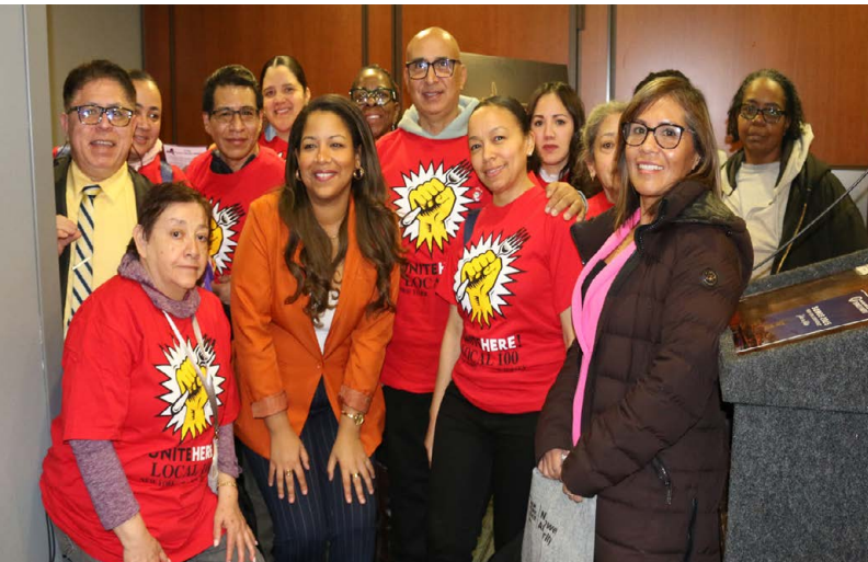
UNITE HERE Local 100 members with Assemblywoman Amanda Septimo.