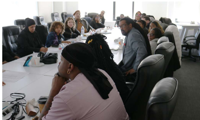
UNITE HERE Local 100 members at the Black History Event.

Let's stand together, lift each other up, and keep pushing forward. The fight for workers' rights is the fight for our future.