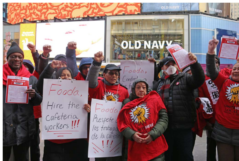
Trabajadores del servicio de Comida de UNITE HERE Local 100 exigiendo que Fooda en Paramount contrate a los trabajadores.