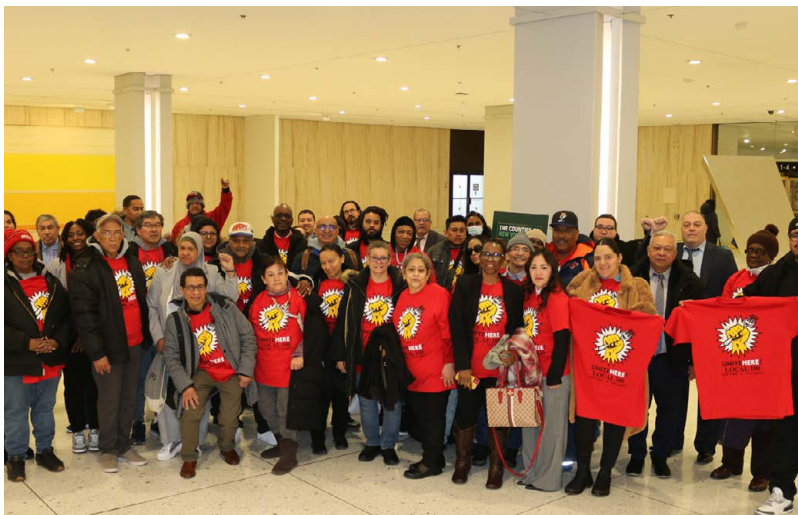
Miembros de UNITE HERE Local 100 en SOMOS Albany 2025.