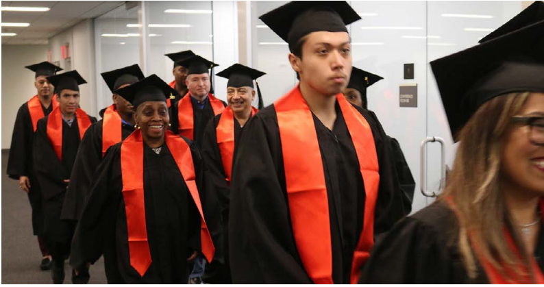
UNITE HERE Local 100 Culinary Education Center students walking to receive their diplomas./Estudiantes del Centro de Educación Culinaria de UNITE HERE Local 100 caminando para recibir sus diplomas.