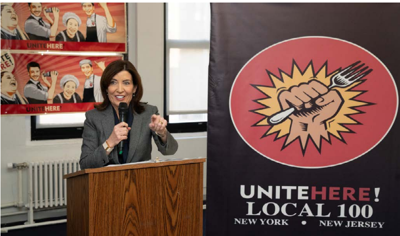
New York Governor Kathy Hochul at UNITE HERE Local 100.