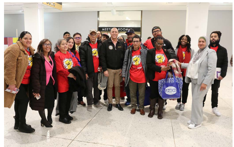
UNITE HERE Local 100 members with Assemblyman George Alvarez.