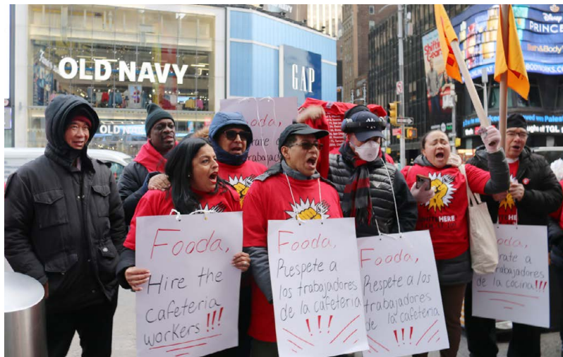
UNITE HERE Local 100 food service workers of Compass/RA at Paramount demanding Fooda to hire the workers.